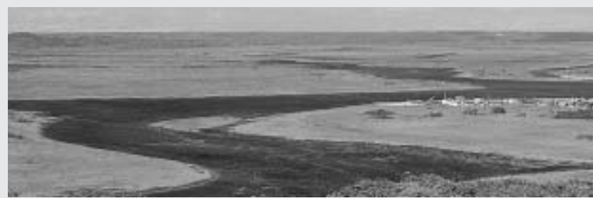
●ビワセ展望台より霧多布湿原を望む